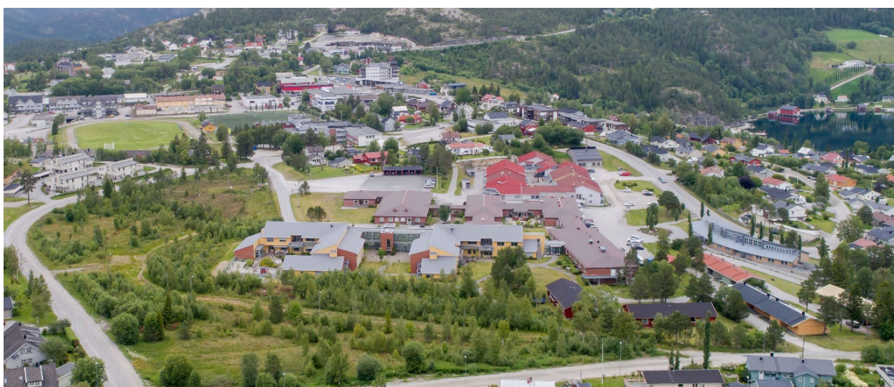
Innen april vil de ansatte i nye Nærøysund kommune få vite hvor i organisasjonen i nykommunen de vil være plassert.

Det er flere grunner til at denne delen av planleggingen må være klar allerede åtte måneder før sammenslåingen offisielt gjennomføres. En viktig grunn er at strukturen på kontoene som skal være med i det første budsjettet og økonomiplanen til Nærøysund kommune må være på plass i april. Da må en også ha en oversikt over hvor de ansatte skal jobbe.